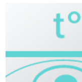
3 степени мощности