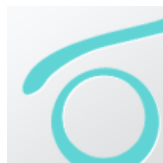
Колесики для легкого передвижения