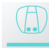
Монтаж над умывальником