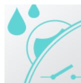
Влагоизолированны й переключатель