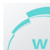
2 степени мощности