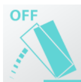
Защита от падения