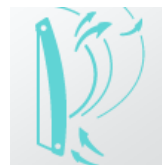
Быстрый и комфортный обогрев