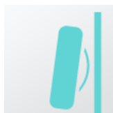
Монтаж на стене